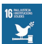
Objectiu 16 UNESCO