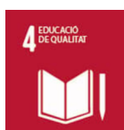
Objectiu 4 UNESCO